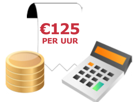
Dure bijstand door bewindvoerder 25